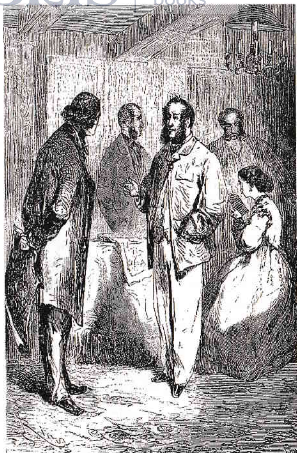
– Continuă, maiorule, spuse Paganel.